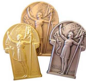
DM-tecken Damjuniorer samt lagtävling Miniatyr till lagskyttar