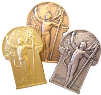
DM-tecken Öppen klass/herrjunior samt lagtävling. Miniatyr till lagskyttar